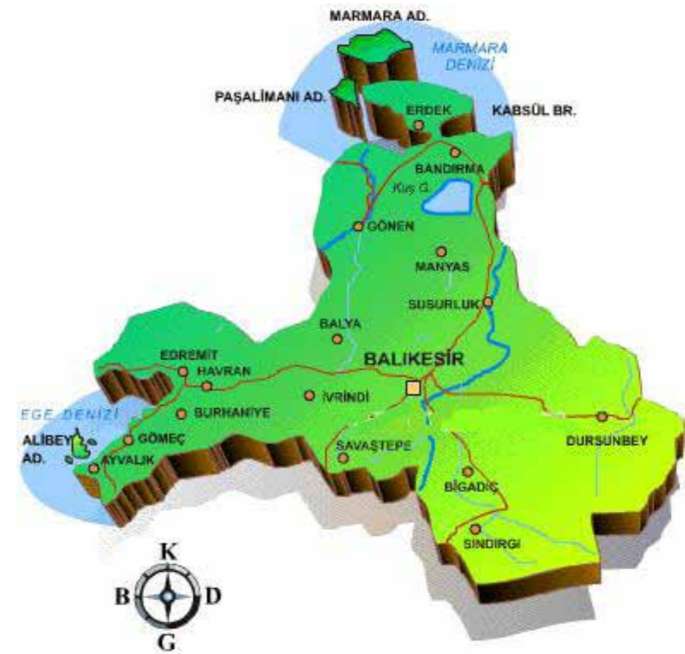
Harita 1: Balıkesir İli

Turizm zenginliği açısından eşsiz imkanlara sahip ülkemiz, turizm pazarından artan bir şekilde yararlanmaktadır. Türkiye'nin uzun vadeli turizm stratejisinin ana hedefi 2023 yılında dünyanın en çok turist çeken ve en fazla turizm geliri elde eden ilk beş ülkesinden biri olmaktır. Türkiye, 2011 yılında turizm gelirleri bakımından dünyada 12. sırada, gelen yabancı turist bakımından ise 6. sıradadır. 2010 yılına kıyasla 2011 yılında ülkemize gelen yabancı turist sayısı %8,7 artarak 29,3 milyona ulaşmıştır 1 . Bölgemiz, Türkiye Turizm Stratejisi 2023 ve Eylem Planı 2013 ile uyumlu olarak ülkemizin doğal, kültürel, tarihi ve coğrafi değerlerini koruma-kullanma dengesi içinde turizm alternatiflerini geliştirmeyi ve ülkemizin turizmden alacağı payı arttırmayı hedeflemektedir.